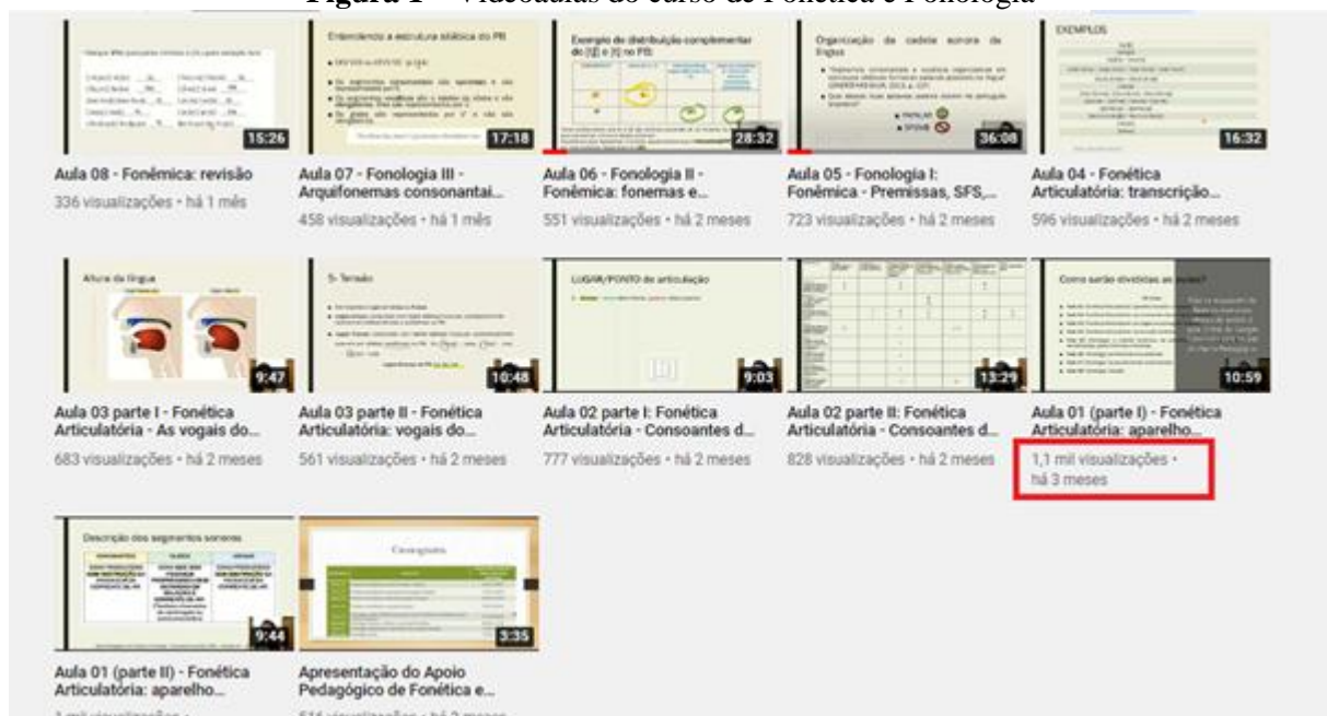
Figura 1 – Videoaulas do curso de Fonética e Fonologia

Além disso, é possível notar, por meio do número de visualizações na plataforma YouTube, que o curso atingiu alunos além dos inscritos nas turmas do Google Sala de Aula, já que no YouTube as videoaulas ficam disponíveis para qualquer pessoa assistir. A Figura 1 abaixo mostra todas as videoaulas disponibilizadas no canal da professora no YouTube e as visualizações de cada vídeo. É possível observar que os vídeos referentes à aula 01 chegaram a mais de mil visualizações.