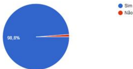
Gráfico 1 - Opinião dos alunos sobre as plataformas utilizadas no curso Você gostou da plataforma usada pela professora? (YouTube e Google Classroom) 241 respostas

Em relação ao curso, foi questionado se os alunos gostaram das plataformas utilizadas nas aulas. O Gráfico 1, a seguir mostra que a grande maioria dos alunos (98,8%) gostou da utilização do YouTube e do Google Sala de Aula. Esse resultado sugere que pode-se permanecer utilizando essas plataformas no próximo semestre.